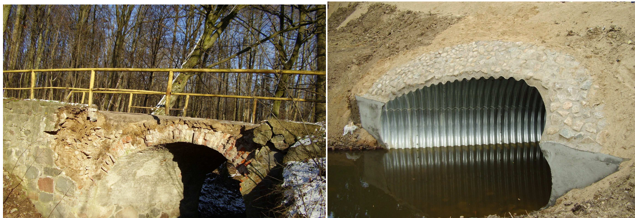
Stan przed przebudową

Zadanie dofinansowane przez Samorząd Województwa z Terenowego Funduszu Ochrony Gruntów Rolnych w kwocie 80 000 zł