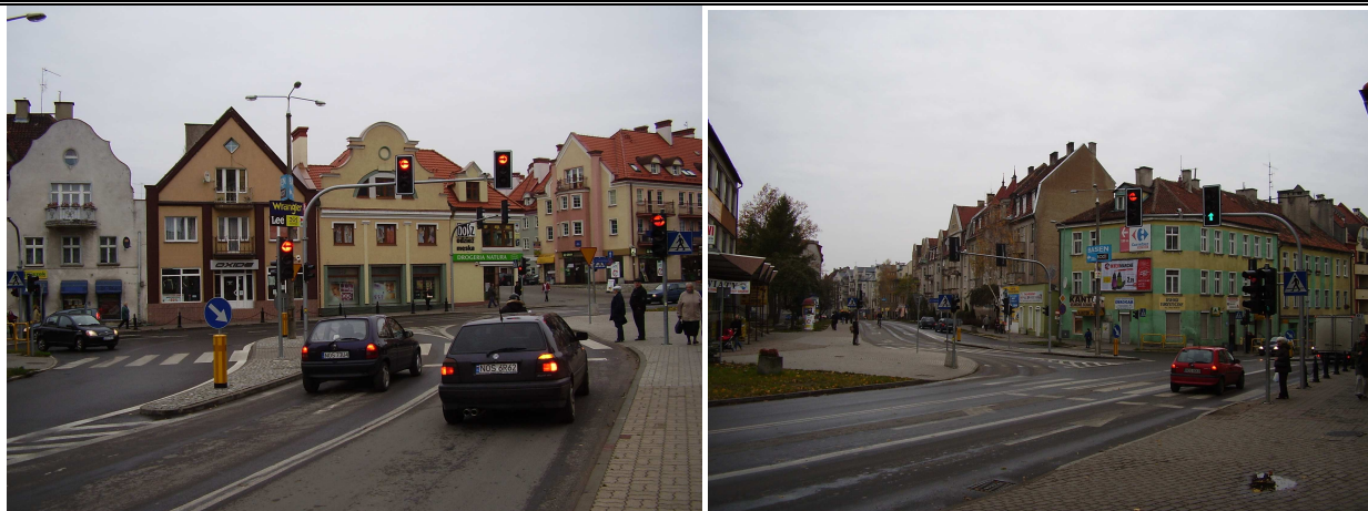
Stan po zmianie organizacji ruchu