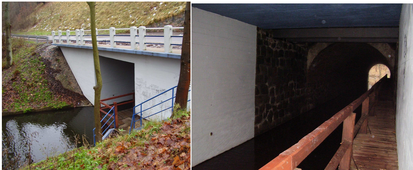
Stan po remoncie mostu