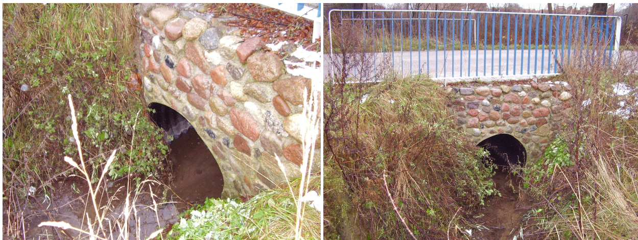
Stan po remoncie przepustu

droga powiatowa Nr 1235N Smykówko- Klonowo miejscowość Naprom, gmina Ostróda, wartość zadania 47 579,77 zł