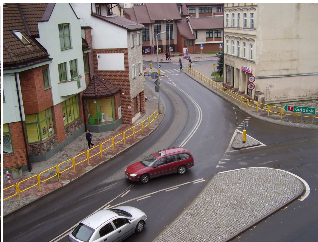
Stan po zmianie organizacji ruchu