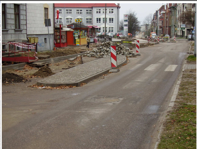
W trakcie robót