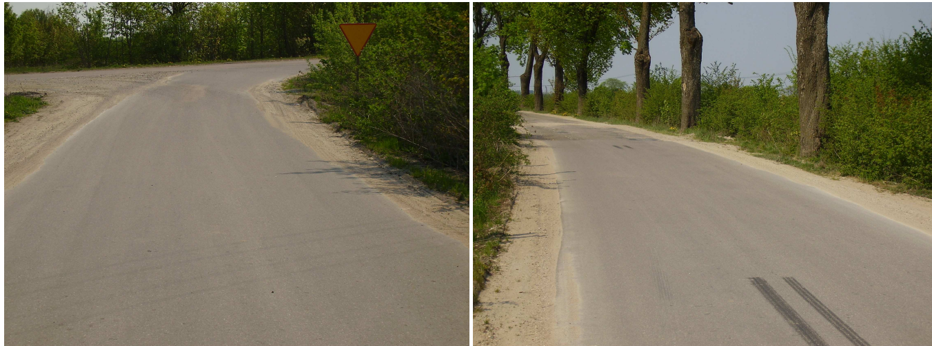
Stan po remoncie nawierzchni

wartość zadania 84 025,12 zł (udział Olsztyńskich Kopalni Surowców Mineralnych w materiałach oraz 40.000zł)