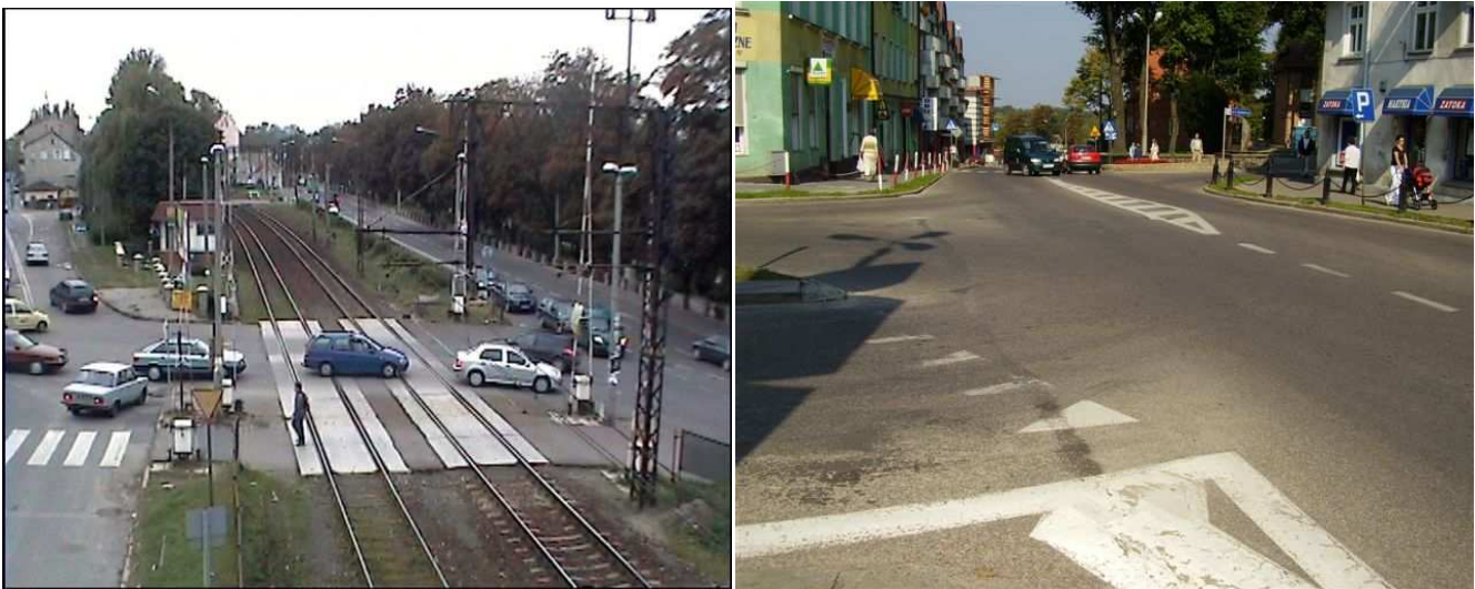
Stan przed zmianą organizacji ruchu

Udział Powiatu Ostródzkiego w kwocie 1 250 896,00 zł