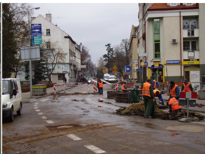
W trakcie robót