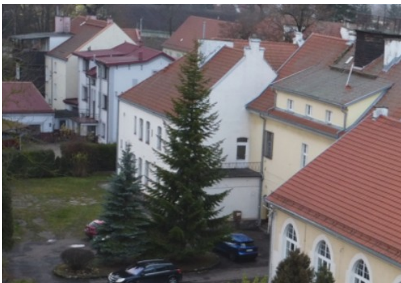
Rysunek nr 1. Widok od strony ul. 11-go Listopada

Obiekt to budynek użyteczności publicznej zlokalizowany w Morągu przy ul. 11-go Listopada 7, na działce nr 625/2, w obrębie geodezyjnym MIASTO MORĄG NR 2.