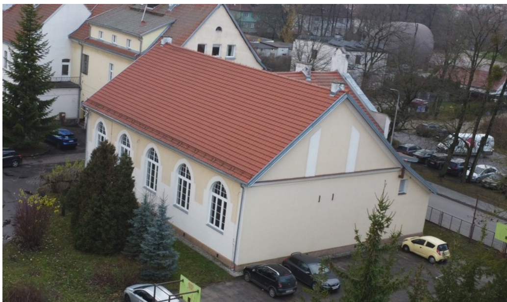
Rysunek nr 1. Widok od strony ul. 11-go Listopada

Obiekt to budynek użyteczności publicznej zlokalizowany w Morągu przy ul. 11-go Listopada 7, na działce nr 625/2, w obrębie geodezyjnym MIASTO MORĄG NR 2.