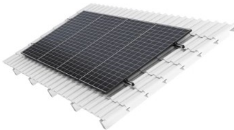
Rysunek nr 2. Konstrukcja wsporcza pod moduły

Należy zastosować konstrukcję montażową, która pozwala na montaż modułów na dachu skośnym na dachówce, rozwiązanie to pozwala optymalnie umiejscowić moduły na dachu budynku.