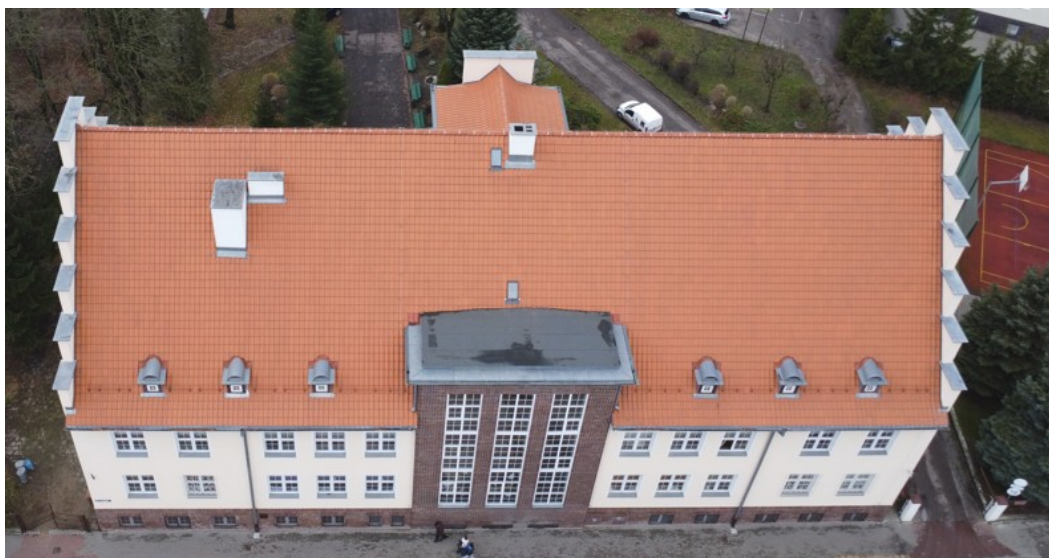
Rysunek nr 1. Widok od strony ul. 11-go Listopada

Obiekt to budynek użyteczności publicznej zlokalizowany w Morągu przy ul. 11-go Listopada 7, na działce nr 625/2, w obrębie geodezyjnym MIASTO MORĄG NR 2.